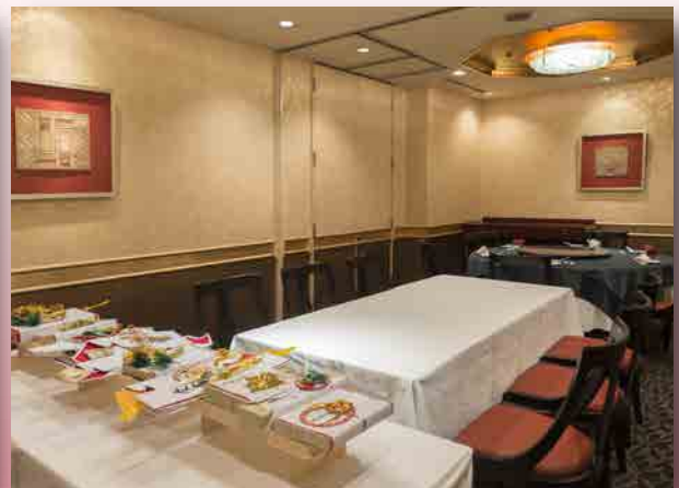
ご結納会場イメージ